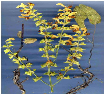
شکل شماره ۱: گیاه مریم گلی ( Salvia limbata )