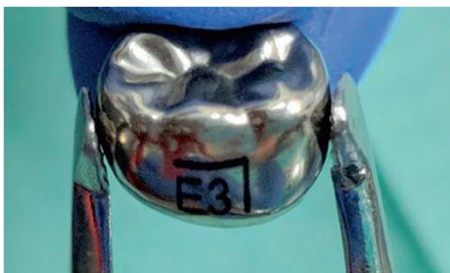
شکل شماره ۱: روکش استیل مناسب دندان E منبیل (۲۷)

ترکیب شیمیایی این روکش ها شامل؛ ۶۹ درصد آهن، ۱۸/۴ درصد کروم، ۹/۱ درصد نیکل، ۱/۱۵ درصد منگنز و فلزات دیگری همچون آلومینوم و مولیبدن می باشد که در این بین نیکل اصلی ترین عامل بروز حساسیت به SSCها می باشد که در موارد شدید این نوع حساسیت می تواند تهدید کننده حیات باشد (۲۶).