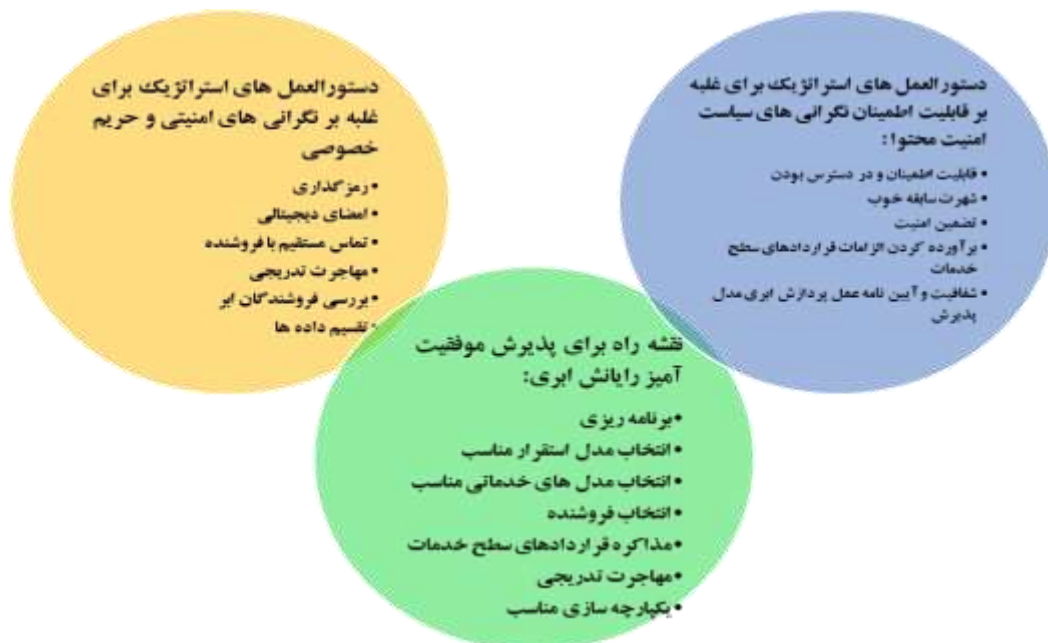
شکل شماره ۱: فرایند پذیرش رایانش ابری در دانشگاه‌ها (۱۰)

و در نهایت، مدیریت داخلی برای تعیین سیاست‌ها و تشکیل یک تیم برنامه‌ریزی به منظور بهینه‌سازی استفاده از ابر برای کاربران و همچنین تعیین نوع و سطح استفاده آن‌ها از ابر، در فرآیند استقرار ابر در هر شرایطی بسیار حائز اهمیت است. علاوه بر این، مدیریت بهتر می‌تواند