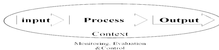
شکل شماره ۲: مدل برنامه‌ریزی عملیاتی IPOCC (۶)