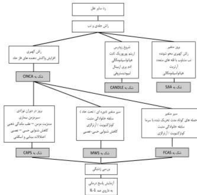
نمودار تشخیصی شماره ۲: برخورد تشخیصی با کودک مبتلا به تب مزمین و راش پوستی