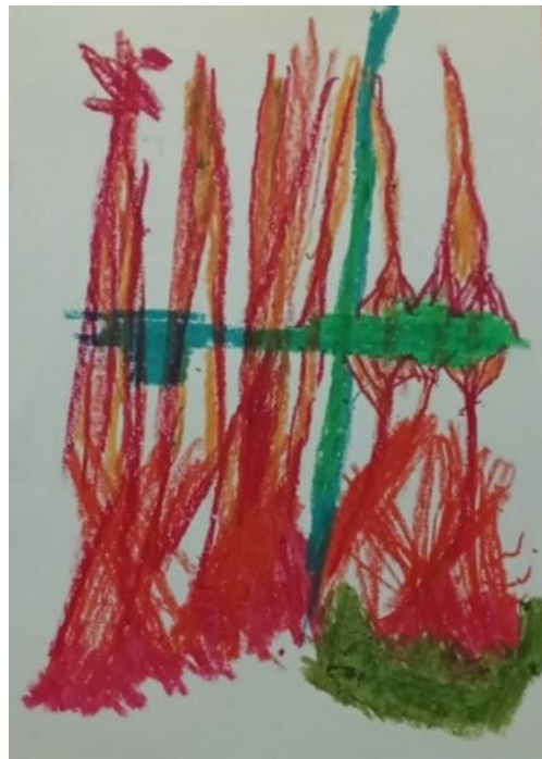
شکل شماره ۲. تصویری از نقاشی ح