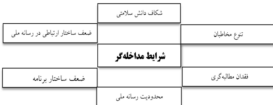
شکل شماره ۲: شرایط مداخله‌گر پژوهش