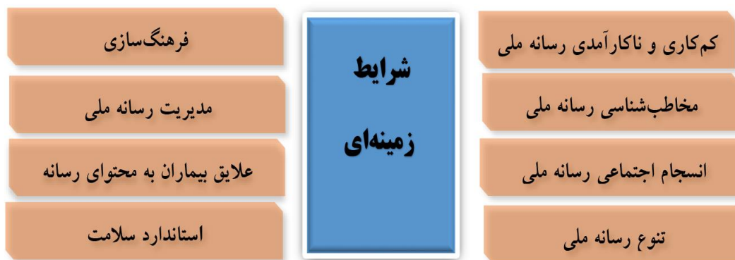
شکل شماره ۱: شرایط راهبردهای رسانه ملی برای ارتقای نانوپزشکی مبتنی بر ابعاد هفت‌گانه سلامت