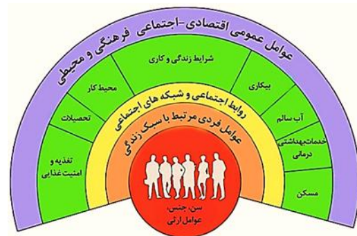
دیاگرام شماره ۱: عوامل اجتماعی مؤثر بر سلامت

امروزه به صورت واضح نشان داده شده است که عوامل اجتماعی نقش بسیار مهمی در سلامت و رفاه در ابعاد فردی، گروهی و جمعی دارند(۴)(دیاگرام شماره ۱).