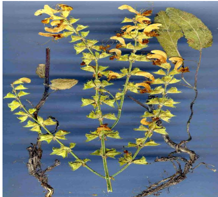
شکل شماره ۱: گیاه مریم گلی ( Salvia limbata )