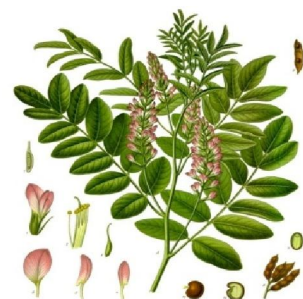
شکل شماره ۱: گیاه شیرین بیان