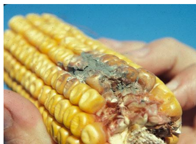
شکل شماره 2: انبارداری غیرصحیح غلات و رشد پنسیلیوم تولید کننده اکراتوکسین A (20)

بخش مهمی از آلودگی غذا به اکراتوکسین A، مربوط به رشد سویه‌های قارچی تولیدکننده این سم در مواد غذایی در شرایط نگهداری در انبار است (شکل شماره 2).