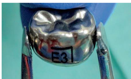
شکل شماره ۱: روکش استیل مناسب دندان E مندیبل (۲۷)

ترکیب شیمیایی این روکش ها شامل؛ ۶۹ درصد آهن، ۱۸/۴ درصد کروم، ۹/۱ درصد نیکل، ۱/۱۵ درصد منگنز و فلزات دیگری همچون آلومینوم و مولیبدن می باشد که در این بین نیکل اصلی ترین عامل بروز حساسیت به SSCها می باشد که در موارد شدید این نوع حساسیت می تواند تهدید کننده حیات باشد (۲۶).